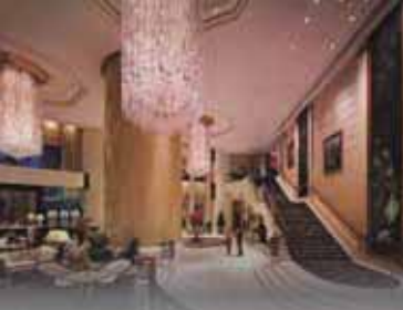
Island Shangri-La, Hong Kong