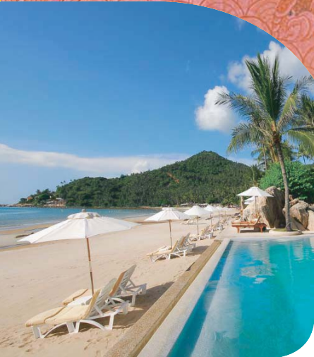
Imperial Samui Beach Resort