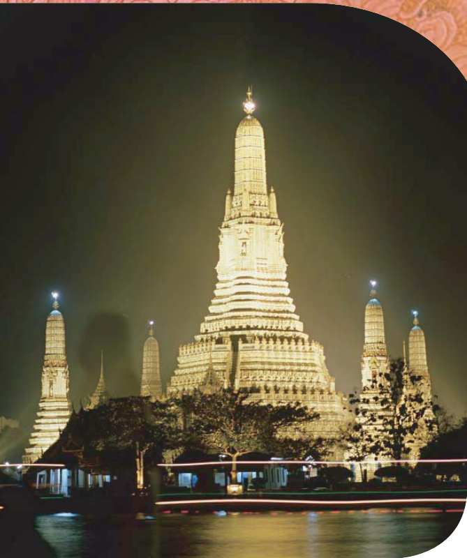
Wat Arun, The Temple of Dawn