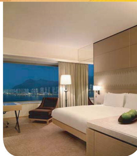
Hyatt Regency Hong Kong, Sha Tin