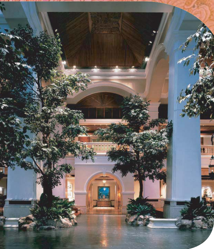
Grand Hyatt Erawan Bangkok