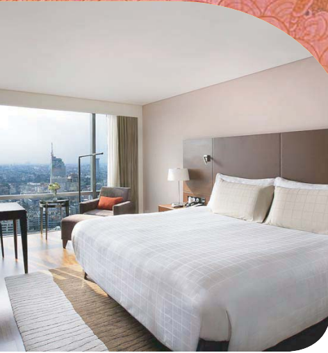
Softel Bangkok Silom